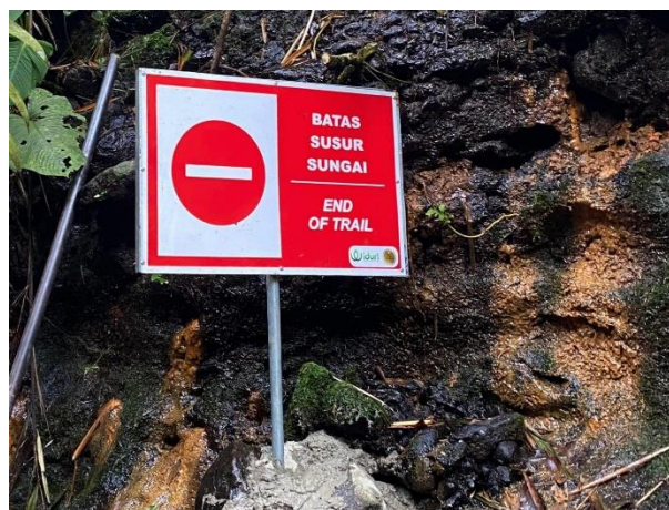
Gambar 1. Tindakan resiensi untuk mengantisipasi kecelakaan di sekitar kawasan wisata

Geliat dan dinamika aktor ditunjukkan melalui tindakan resiensi untuk mengantisipasi musibah di sekitar kawasan wisata. Hal tersebut dilakukan melalui signage yang mengarah pada jalur evakuasi dan juga titik kumpul (Sengkuni, wawancara mandiri, 15 Januari 2026). Penambahan fasilitas tersebut bekerjasama dengan Tim Turi Berdikari, yang mana sebanyak delapan plang telah didirikan di berbagai posisi. Plang tersebut antara lain: dilarang melintas sebanyak satu buah, titik kumpul sebanyak satu buah, jalur evakuasi sebanyak tiga buah, batas trekking sebanyak satu buah, identitas air terjun sebanyak satu buah, dan hanya boleh dilintasi satu orang sebanyak satu buah (lihat Gambar 1 ).