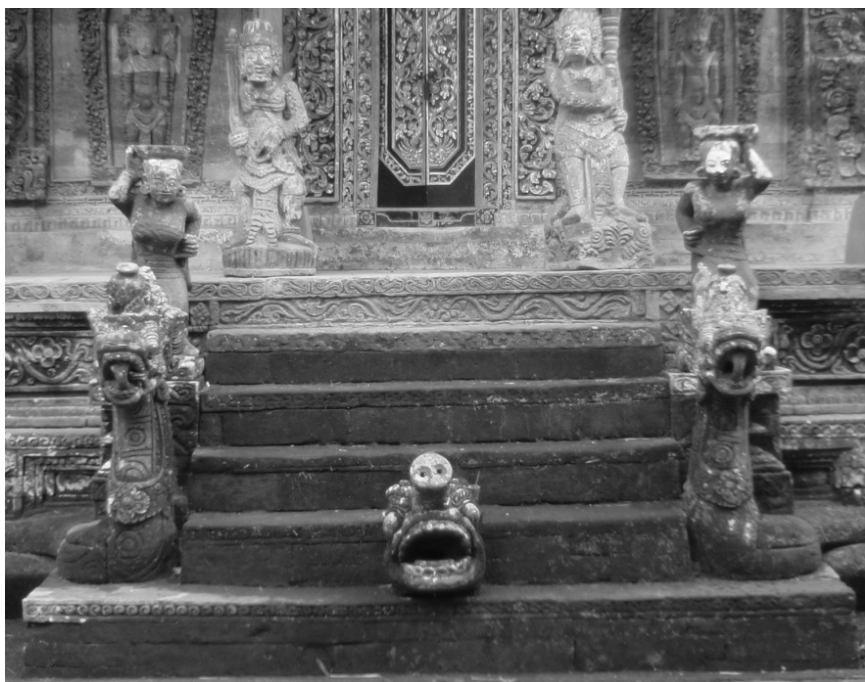
Gambar 7. Ornamen bedawang nala dengan dua ekor naga di dasar meru di Pura Kehen, Bangli