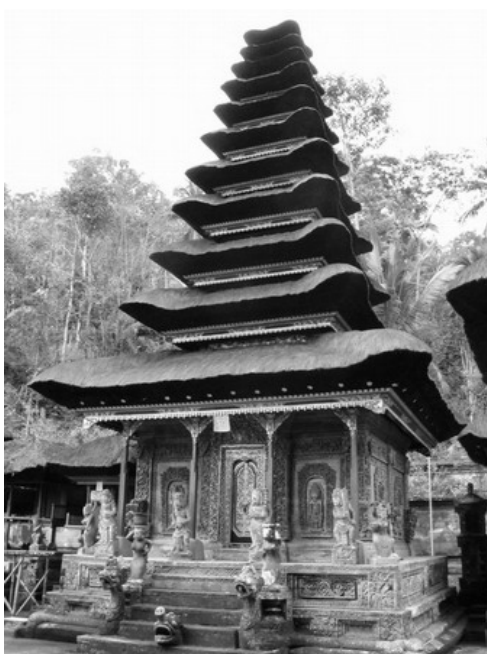
Gambar 6. Meru di Pura Kehen, Bangli