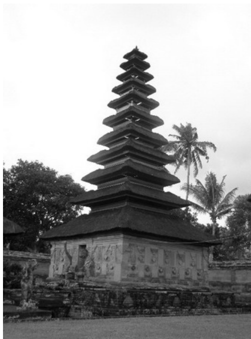
Gambar 4. Meru di Pura Taman Sari, Klungkung