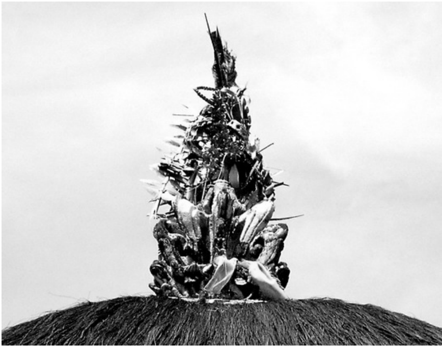
Gambar 2. Ornamen Murdha