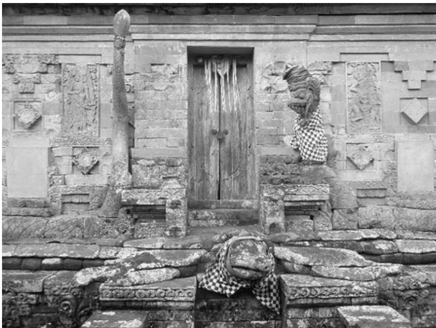
Gambar 5. Ornamen bedawang nala dengan seekor naga di dasar meru di Pura Taman Sari, Klungkung